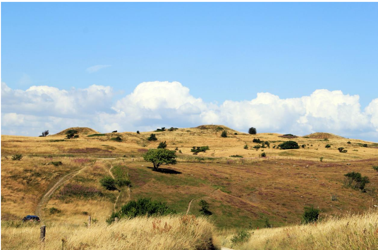
Trehøje Mols bjerge

Endelig og for det niende skal den nye nationalparkchef være optaget af at identificere, være initiativtager og formidle kontakten til potentielle bidragsydere til Nationalpark Mols Bjerge. Realiseringen af nationalparkens ambitioner om bl.a. et besøgscenter, men også en generel udvikling af nationalparkens aktiviteter, vil få et styrket momentum via tilførsel af fondsmidler mv.